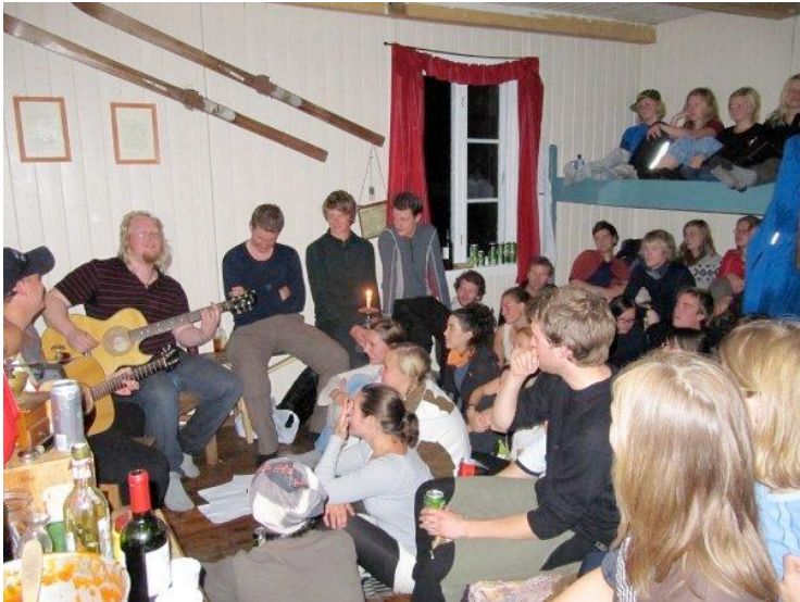
De Skadeskutte rocker Kreklingbu