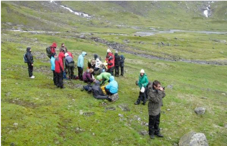
Through “multebær” rich valleys

that were constantly running beside us. The idea of hiking became clearer to me – being in nature, away from the luxury of our daily lives.