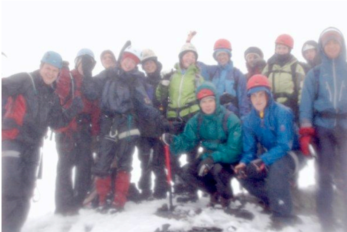
På toppen av Falketind??