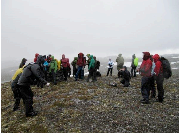
Snow, fog and joy at Hallingskeid