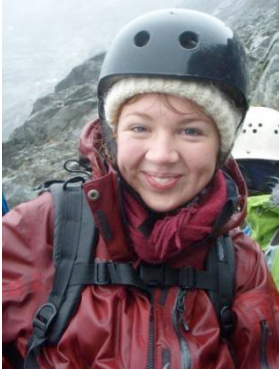
I tilsynelatende godt humør

om han fant spor etter sivilisasjon. Ei frøken hadde glømt hodelykt, den fjerde overraska med psykisk ustabilitet, 90'-modellen var "sulten, våt, trøtt og kald", og jeg var fremdeles usikker på om den såkalte krisesituasjonen var ekstraordinær, eller bare en naturlig del av helgeturen.