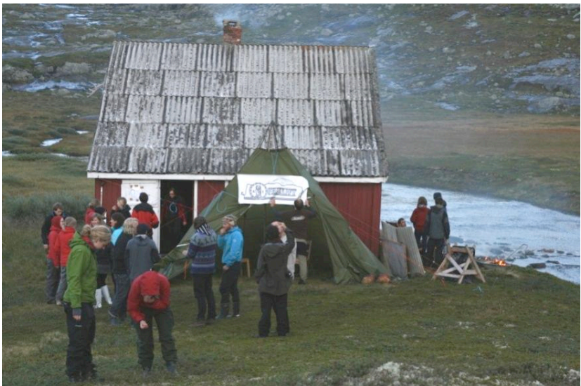
Kreklingbu amfi gjøres klart til konsert.

friluft sitt program. Som initiativtaker og festivalleder vil jeg takke alle som hjalp til med arbeid, alle musikere som stilte opp gratis og alle dere som ble med på denne turen!