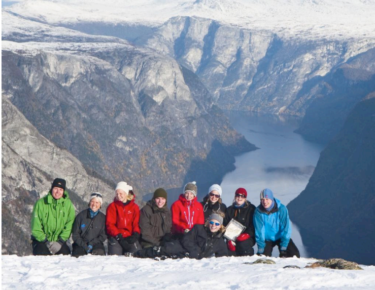
Utsikt mot Nærøyfjorden