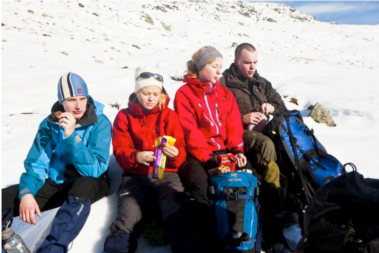
Sjokoladen og appelsin er tatt frem.

skyene begynne å rulle innover. Det var tydelig at høsten ville komme tilbake. Påsken sitt tidlige inntog hadde nok provosert den. Takkneilige for å ha tatt del i nettopp det, satte vi kursen mot Bergen igjen.