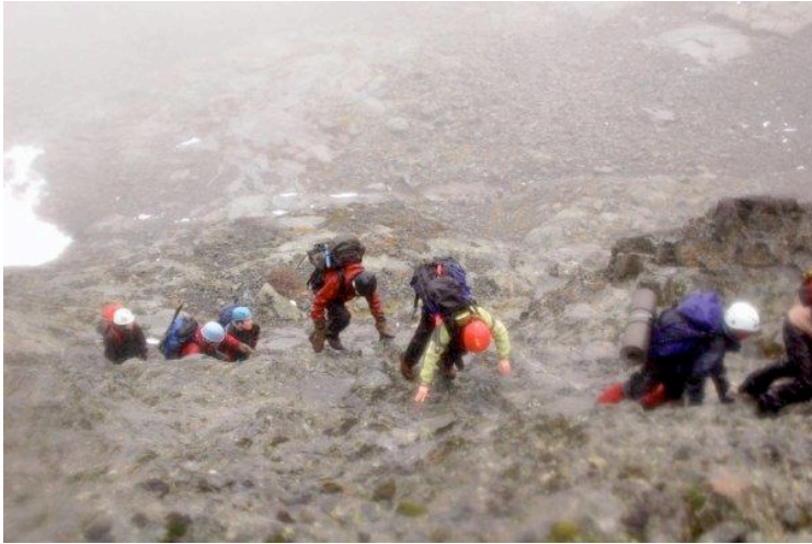
Falketind byr på bratt terreng